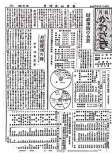
第1号 昭和25年6月1日発行。当時は1枚の両面印刷。

第1号は、町の財政事情や行政などが主に掲載されており、町の新聞としての役割が大きいものでした。