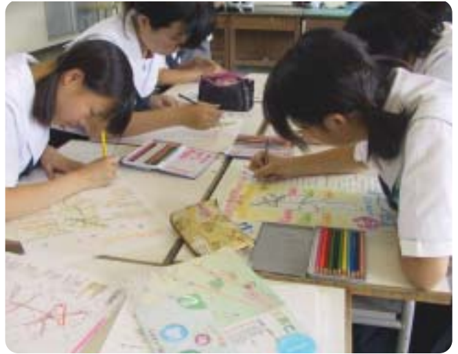
▲池中美術部員たちが熱心に作成

生徒たちは、子育てマップを作りながら自分が知らない場所を見つけると「わあ～行ってみたい、どんなとこやか」と目を輝かせていました。生徒の一人が絵を描きながら「自分が子どもの時にこんなマップがあれば良かったのにとつぶやいていたのが印象的でした。