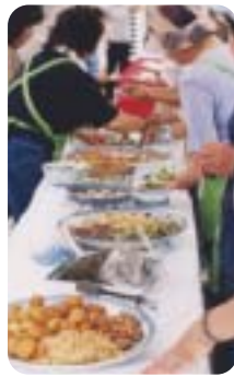
▲さなぶり料理がズラリ