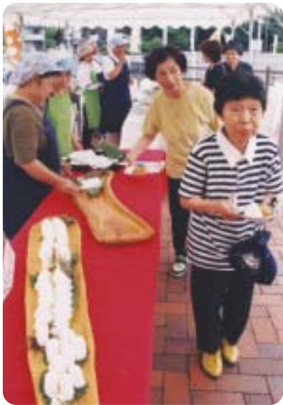
▲おいしい料理をいただきます