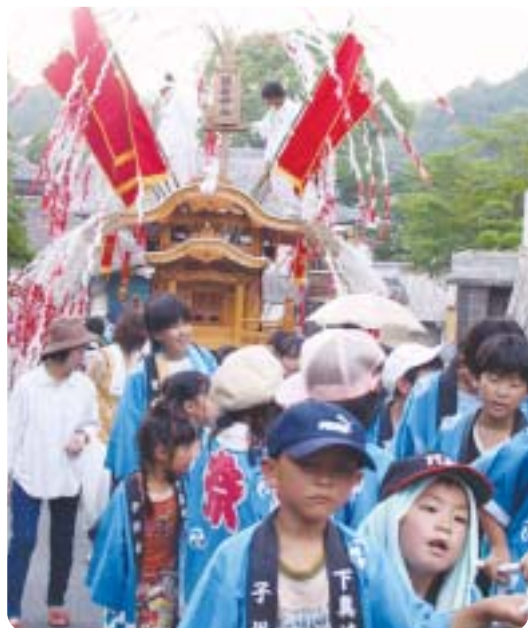
▲子どもたちは、少し暑さにバテぎみかな？