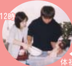
初めての沐浴体験中

日 時 平成16年9月5日(日) 受付 10時～10時10分 終了 12時 場 所 川崎町保健センター 参 加 料 無料 募 集 期 間 9月1日(水)まで 募 集 人 員 30人程度 申 込 先 社会教育係 ☎内線409 保健係(保健センター) ☎72-7083 申 込 方 法 電話で申し込みください 問 合 わ せ 保健係(保健センター) ☎72-7083