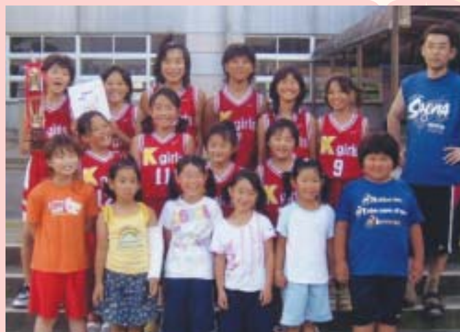
▲次こそ、優勝をめざそうね