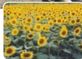
▲昨年のひまわり畑