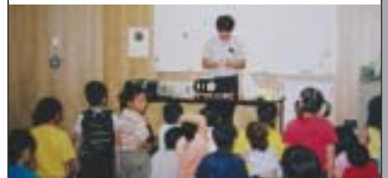
▲びっくりするマジックが次々と飛び出しますよ

8月の行事 絵本の読み聞かせ 8日(日)・22日(日)・28日(土) いずれも14時より