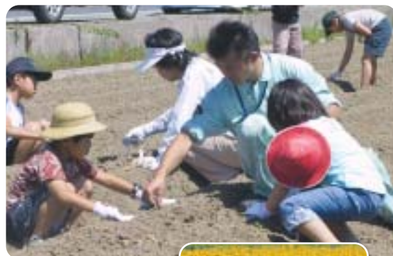
▲大きなひまわりが咲きますように

「原方地区農村を考える会」は、地域の農村についてまじめに考えようと、昨年結成されました。みなさんも、夏を目で楽しんでみませんか。