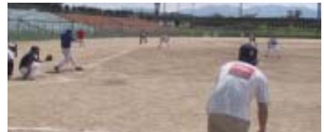
▲今年も熱い戦いに

期 日 9月5日(日) 雨天の場合は 9月12日(日) 場 所 町民運動公園など 参加料 1チーム 3,000円 問い合わせ 社会教育課 ☎内線408・409