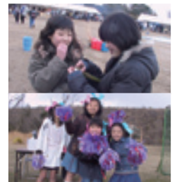
◀おいしく、焼けたかな