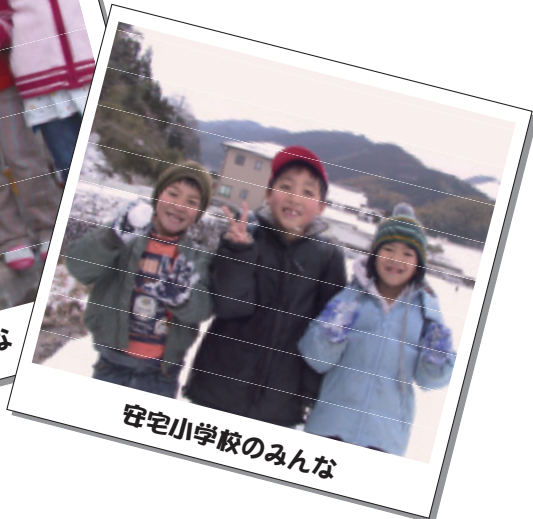
安宅小学校のみんな