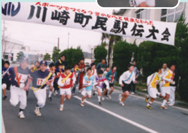
▲はく息が白い中のスタート