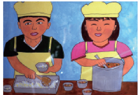
◆町長賞(中学年の部)