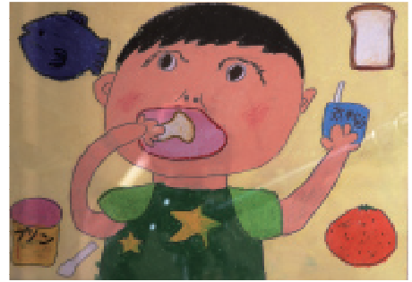
◆町長賞(低学年の部)