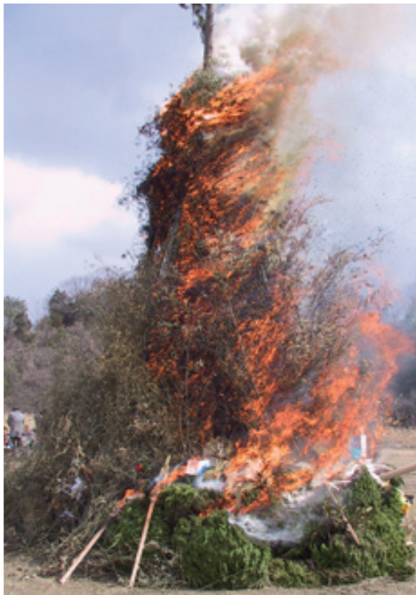
▲高々と燃え上がる炎

この行事は平成10年に復活してから、学校と地域、大人と子どもなど、地域のコミュニケーション醸成の場として、今では、大峰地区になくてはならないはしらの行事に成長しました。アトラクションも、子ども達による踊りや、すみれ保育園の保育士さんによる“大峰鬼火太鼓”など多彩で、また焼きそば・うどん・カレーなどの出店もあり、訪れた約300人の参加者は高々と燃え上がる炎を見ながら、あまり遠くない春を感じているようでした。