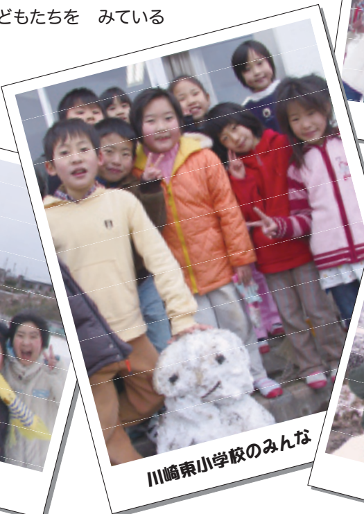
川崎東小学校のみんな