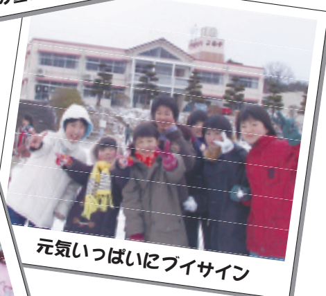
元気いっぱいブイサイン