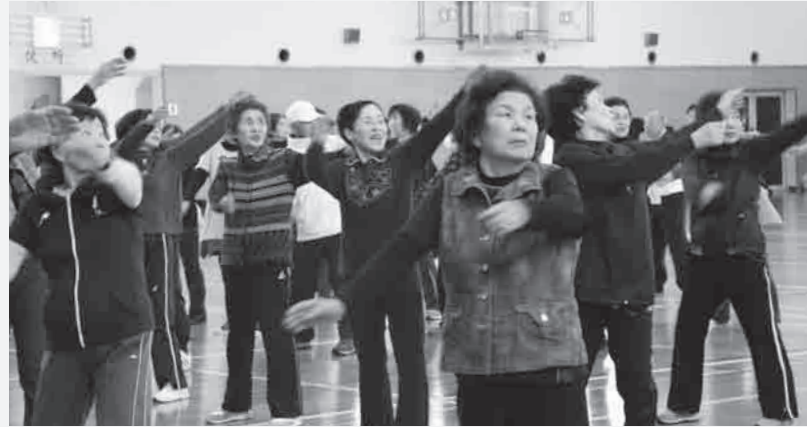
▲毎日続けて生活習慣病を予防しましょう

真冬の寒さとなったこの日、田川地区から約120人の参加者が集まりました。体をまんべんなく動かすために必要な運動が組み合わさっているラジオ体操。講師の指導を受け、ひとつひとつの動きに注意しながらやっていると体が温まり、着込んできた上着を徐々に脱いでいく参加者の姿が多く見られました。