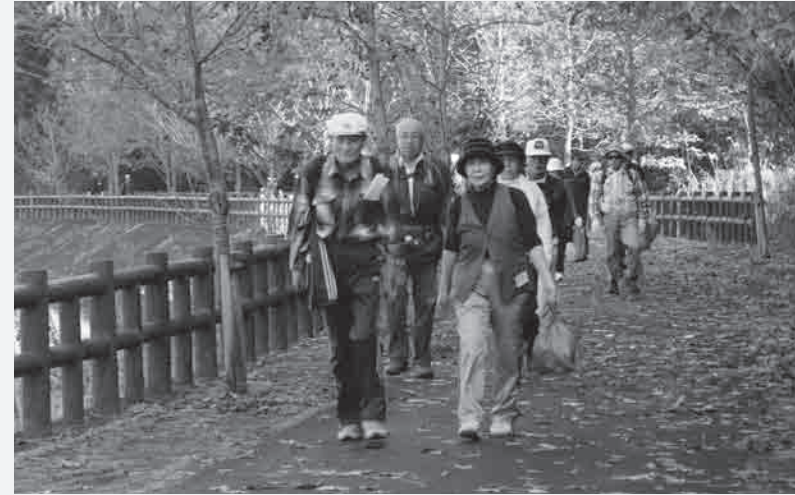
▲紅葉がきれいな雪舟ロード