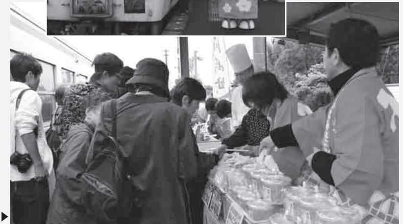
川崎町の味を求めて殺到▶